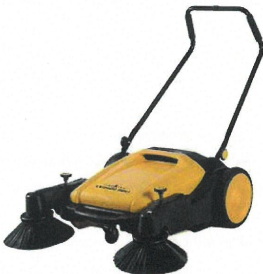
Măturător cu împingere manuală cu perii pentru curățarea trotuarelor