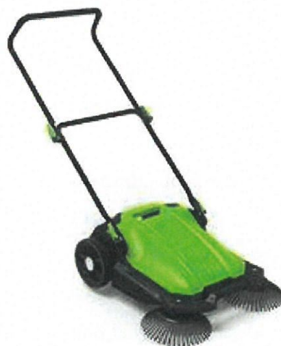
Măturător cu împingere manuală pentru colectarea frunzelor