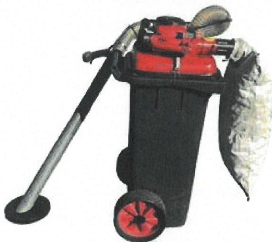
Aspirator stradal tip pubelă