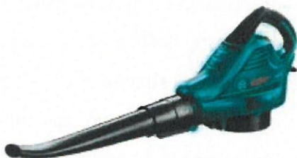
Suflantă pentru frunze