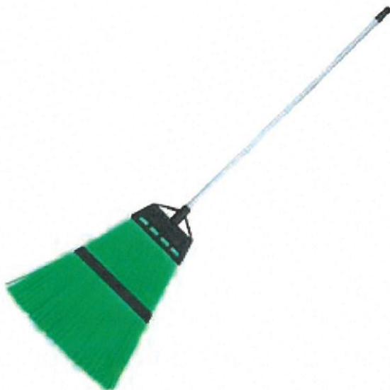
Mătură de stradă cu montură din lemn sau PVC și bosaj din plastic

În scopul salubrității manuale a carosabilului, trotuarelor, parcărilor și locurilor de joacă, se pot folosi următoarele echipamente și utilaje, fără a se limita la acestea: