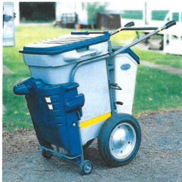
Cărucior profesional de curățenie și întreținere stradală